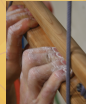
In der Halle

Die Nutzung des Hangboards erfolgt ausschließlich auf eigenen Gefahr. Der Anwender ist selbst verantwortlich für die Festigkeit des Knotens, mit dem die Reepschnur am Hangboard befestigt ist, sowie die Festigkeit und Höhe des Aufhängepunktes, an dem das Hangboard aufgehängt wird, so wie die Beschaffenheit des Untergrundes über dem das Hangboard aufgehängt wird (wir empfehlen einen weichen, ebenen und ausreichend großen Untergrund).